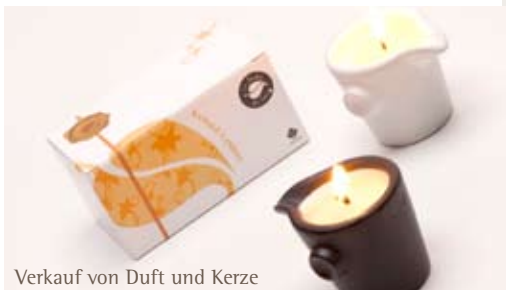
Verkauf von Duft und Kerze

„Les Jardin de sens“ ist ein Parcours der Sinne, ein Ritual, das aus angenehmen Etappen besteht, auf dem Weg der Wiederentdeckung des „Ichs“ und des eigenen Wohlgefühls. Eine Massagekerze ist der Dreh- und Angelpunkt der Anwendung. Ist sie erst einmal angezündet verströmt sie einen wunderbaren Duft, löst sich langsam in ihrer Beschaffenheit aus 100 % Bio Pflanzenstoffen auf und wird zu einer sanften verstreichbaren Creme, welche für die Wohlfühlmassage auf den Körper aufgetragen wird. Es pflegt Ihren Körper mit den Spezialölen, die eine erhöhte Hautverträglichkeit aufweisen und Ihrer Haut erneut Tonus und Geschmeidigkeit verleihen.